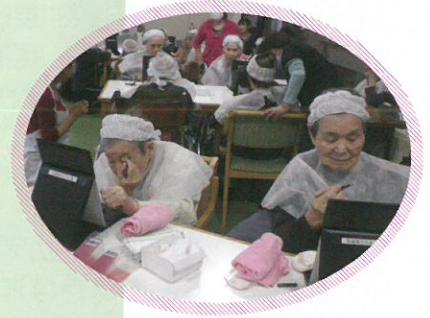
お化粧品教室の様子です