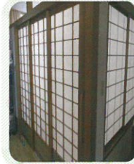
多床室 (4人部屋です)