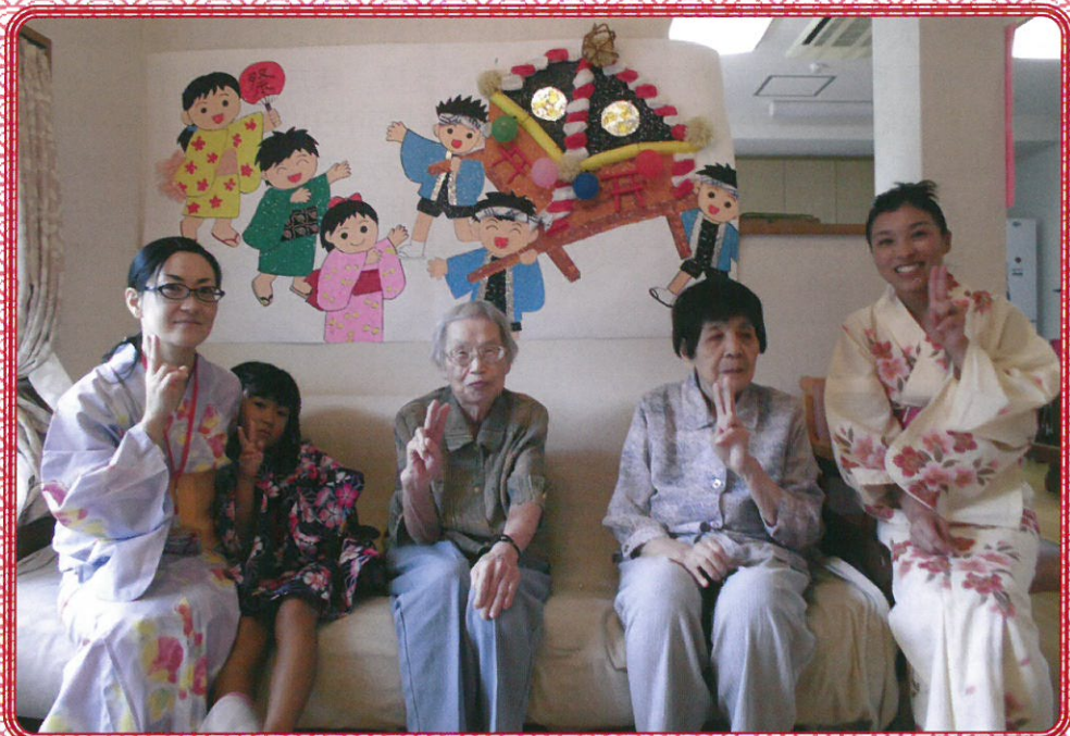
地域密着型サービス「すずらん」より♪